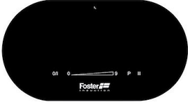
Kochfeld Touch Control Modular Induction 7368 020