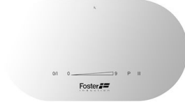
Kochfeld Touch Control Modular Induction 7368 025